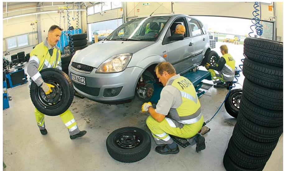
Reifenwechsel im Akkord: Der Testfahrer bleibt dabei im Auto sitzen – um Zeit zu sparen