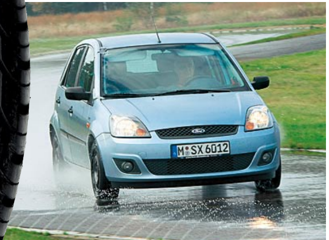
Regen von unten auf dem Contidrom bei Hannover: Das Testfahrzeug für die 175er-Reifengröße war ein Ford Fiesta

Bei der kleinen Reifengröße für Kompaktfahrzeuge wie Ford Fiesta, Honda Jazz, Mitsubishi Colt oder Renault Clio präsentieren sich vier Modelle sehr ausgewogen und erreichen das ADAC-Urteil »besonders empfehlenswert«: Neben dem bewährten Continental EcoContact 3 sind es die drei Neuentwicklungen Pirelli Cinturato P4, Fulda EcoControl und Kumho Solus KH17. Der Pirelli knüpft damit an die Erfolgsgeschichte des Vorgängermodells P3000 an, während der Goodyear-Tochter Fulda endlich einmal wieder ein erfolgreicher neuer Wurf gelungen ist. Und die Koreaner haben rasant aufgeholt: War der alte Kumho KH15 in früheren Tests »nicht empfehlenswert«, steht der Solus KH17 jetzt an der Spitze.