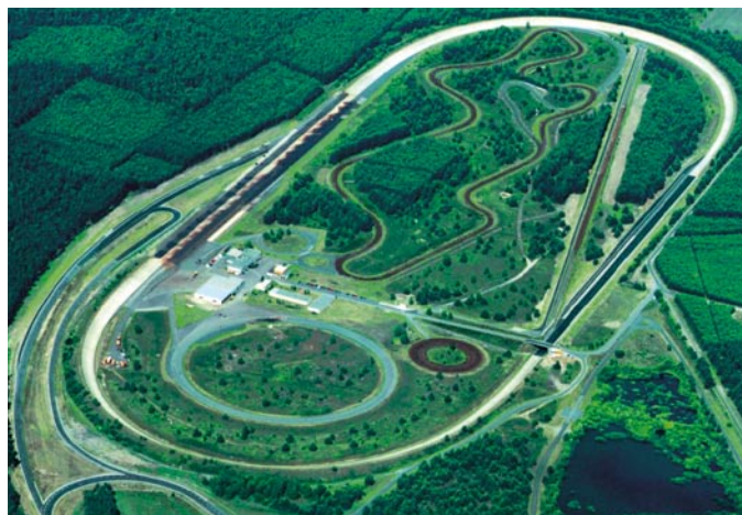
Das Contidrom in Jevern bei Hannover aus der Luft: Die einzelnen Testsektionen sind gut zu erkennen, auf der langen Ovalstrecke messen wir den Spritverbrauch der einzelnen Reifen

Hinter dem breiten und immer noch empfehlenswerten Mittelfeld platziert sich der bereits angesprochene Brillantis von der Conti-Zweitmarke Barum. Seine Technik kann nicht neuester Stand sein: Der Zielkonflikt zwischen seinen guten Verschleiß- und Kraftstoffverbrauchswerten und dem schlechten Nass-Grip ist nur unbefriedigend gelöst.