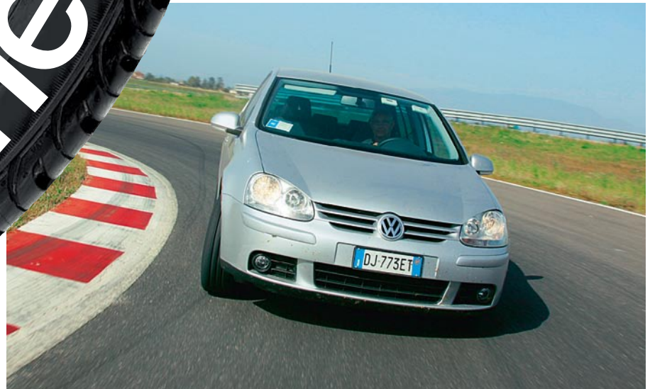
Trockene Kurvenhatz auf dem Bridgestone-Gelände bei Rom: Mit dem VW Golf prüften wir die 195er