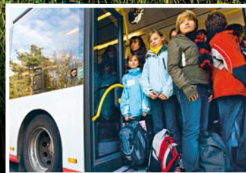
ADAC-Check: So gefährlich sind Schulbusse Seite 60