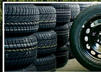
Sommerreifen: 37 neue Modelle im Test Seite 42

Hilfe im Ausland: So arbeiten die Notrufstationen des Clubs Seite 70