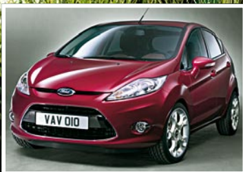
Exklusiv: Erste Fotos vom Ford Fiesta 5-Türer Seite 11

Er rettet das Klima und zerstört die Natur, er spart CO 2 und kostet mehr Geld. Millionen Autos vertragen ihn nicht. Alles über den geplanten E10-Kraftstoff